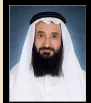
الشيخ ناصر بن محمد بن جبر آل ثاني رئيس مجلس الإدارة