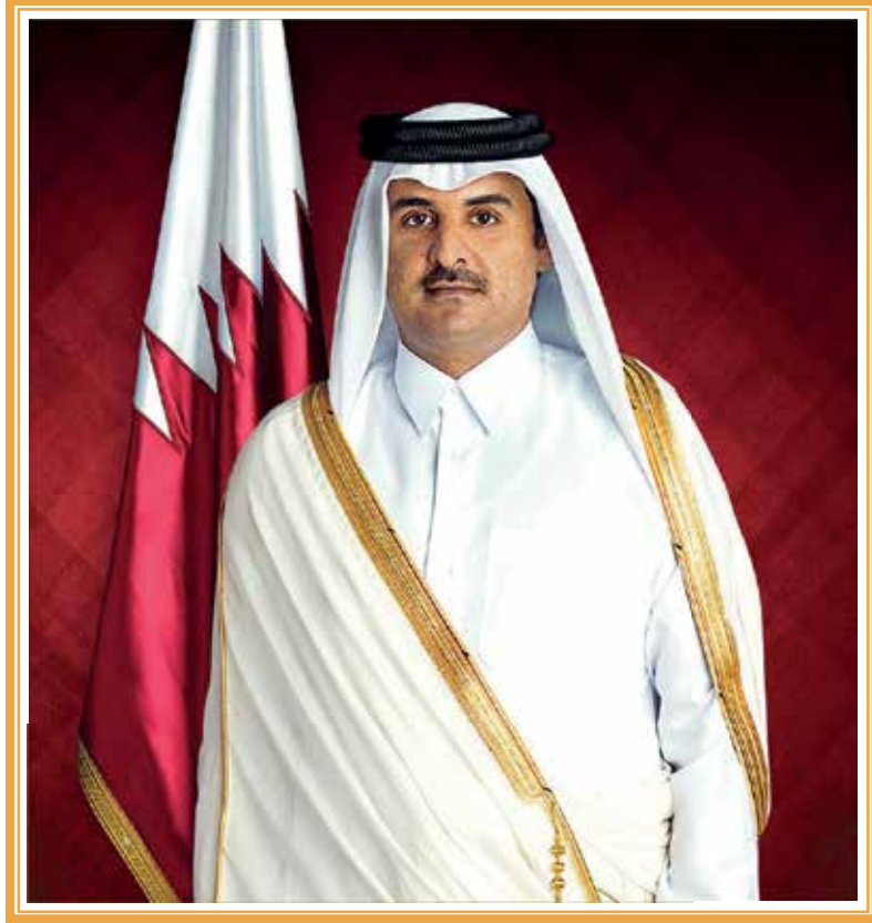
حضرة صاحب السمو الشيخ تميم بن حمد آل ثاني أمير البلاد المفدى